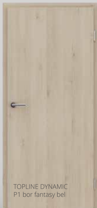
TOPLINE DYNAMIC P1 bor fantasy bel