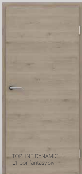
TOPLINE DYNAMIC L1 bor fantasy siv