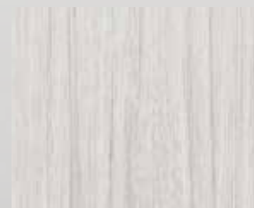
TOPLINE palisander beli