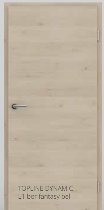
TOPLINE DYNAMIC L1 bor fantasy bel