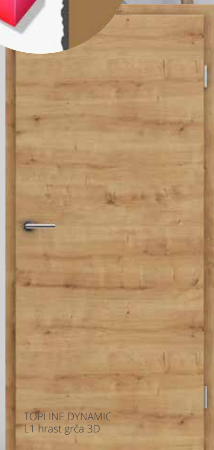
TOPLINE DYNAMIC L1 hrast grča 3D