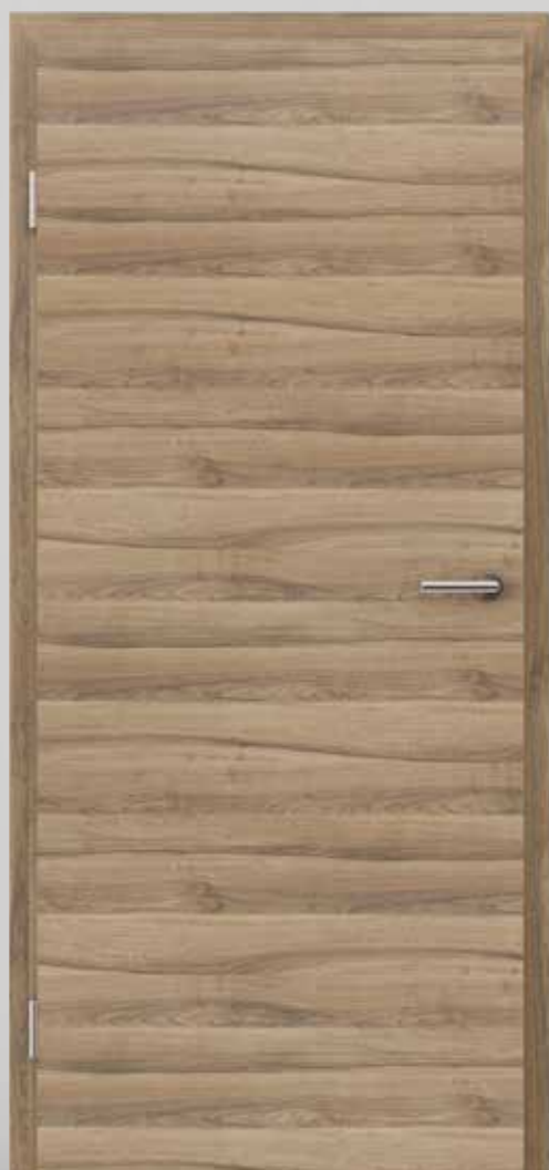
TOPLINE L1 oreh MEDITERAN