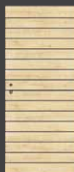
model L1 prečna struktura