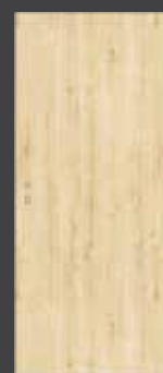
model P1 pokončna struktura