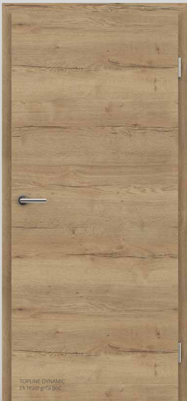
TOPLINE DYNAMIC L1 hrast grča poč

Nova razširjena ponudba foliranih površin DYNAMIC s hrapavo 3D površinsko strukturo je odličen in hvaležen nadomestek klasičnim HRASTOVIM furniranim vratom.