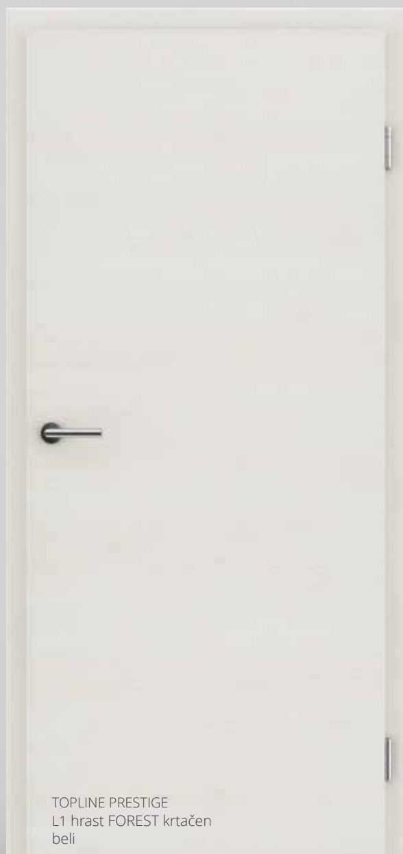
TOPLINE PRESTIGE L1 hrast FOREST krtačen beli

Iz narave črpamo navdih. Površina s sinhroniziranimi porami za videz pravega MASIVNEGA lesa.