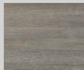
TOPLINE L1 hrast sivi