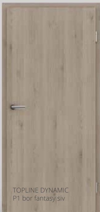
TOPLINE DYNAMIC P1 bor fantasy siv