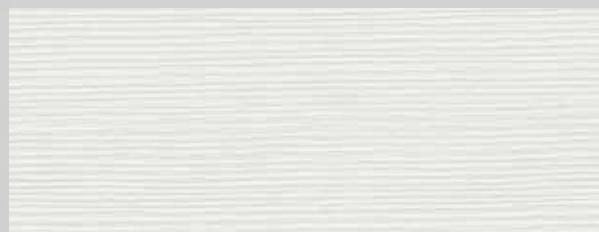
TOPLINE L1 snežno bela