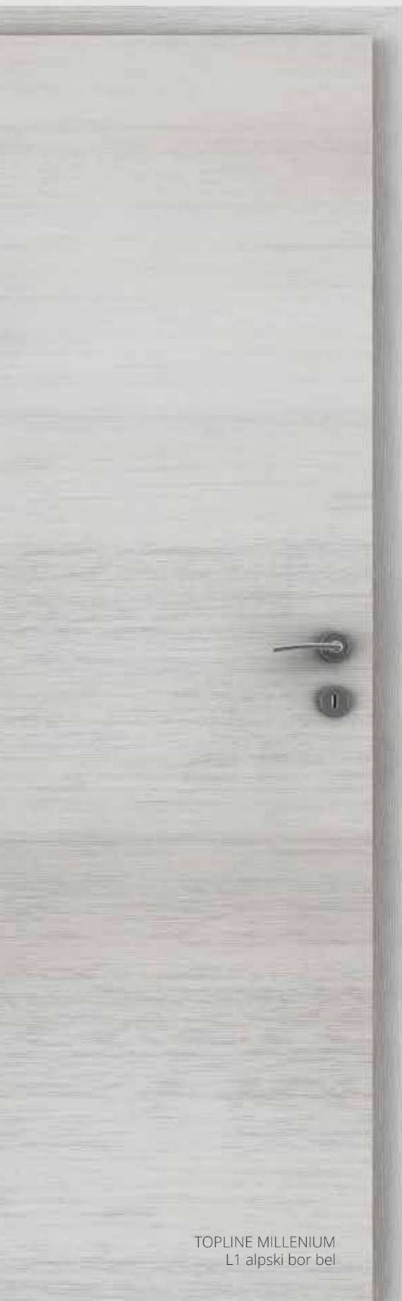
TOPLINE MILLENIUM L1 alpski bor bel

Površina, ki navdušuje s popolno strukturo videza FINE-LINE furnirja.