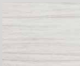
TOPLINE L1 palisander beli