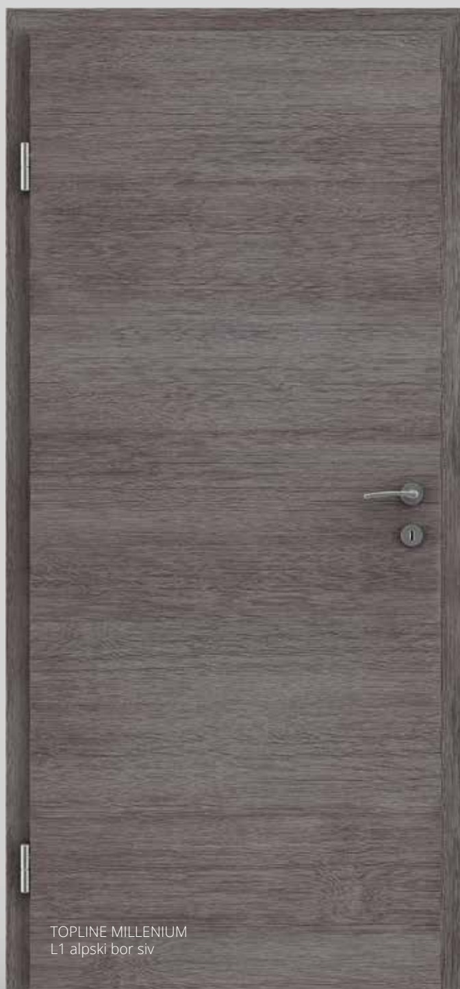
TOPLINE MILLENIUM L1 alpski bor siv