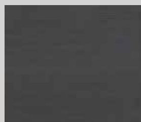
TOPLINE L1 hrast grafit