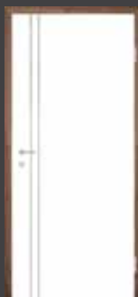
T5 "PVC ALU" vstavek 10 mm T15 "PVC ALU" vstavek 5 mm