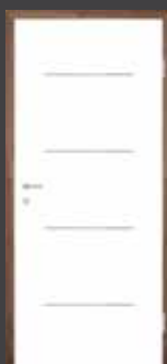
T2 INOX vstavek