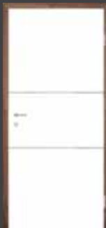
T8 "PVC ALU" vstavek 10 mm T14 "PVC ALU" vstavek 5 mm