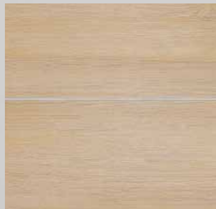
TOPline / L1 MILLENIUM alpski bor bež T40