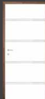
T18 "PVC ALU" vstavek 5 mm