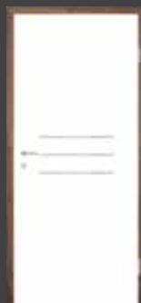
T4 INOX vstavek