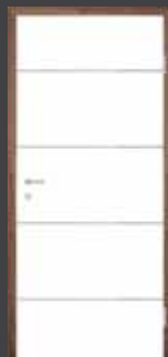
T1 "PVC ALU" vstavek 10 mm T13 "PVC ALU" vstavek 5 mm