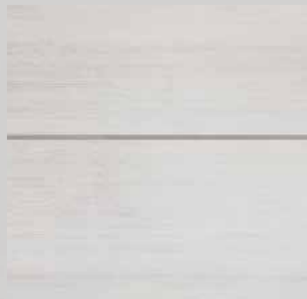
TOPline / L1 MILLENIUM alpski bor beli T40