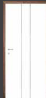
T10 "PVC ALU" vstavek 10 mm