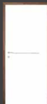
T16 INOX vstavek