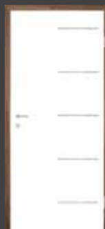
T17 INOX vstavek